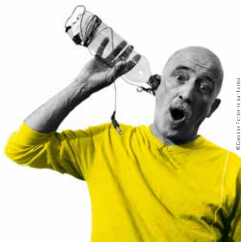
© Caroline Pottier - Le bar floréal